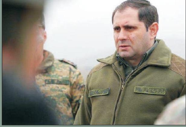
Ermənistanın müdafiə naziri Suren Papikyan hərbi xidmət müddətinin azaldılmasından danışır.

Parlamentdə çıxış edən Papikyan deyib burada bir məqsəd var: Ermənistan ordusunu daha peşəkar etmək. Onun sözlərinə görə, bu qərar orduya qəbulun səmərəliliyinin artırılmasına əsaslanır. Nazir konkret rəqəmlər verməkdən imtina edib və qeyd edib ki, onları əvvəllər də səsləndirib.